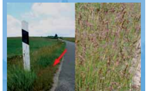
Der Gewöhnliche Salzschwaden ( Puccinellia distans ) am Straßenrand bei Neunhausen.

Straßen, ihre Bankette, Gräben und z.T. auch die Böschungen sind Lebensräume, die in der Regel als wenig wertvoll gelten. Zudem machen eine Reihe von Faktoren den Pflanzen entlang der Straßen das Leben schwer, darunter auch das Streuen von Auftausalzen. Doch trägt gerade dieses dazu bei dass sich in den letzten Jahrzehnten hier vermehrt Pflanzen der Meeresküsten und von Binnenland-Salzstellen ausbreiten.